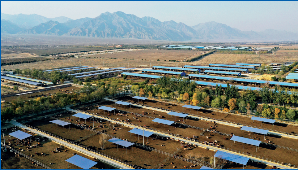
场(10月18日摄,无人机照片)。 (集团)有限公司贺兰县暖泉万头肉牛 这是宁夏农垦贺兰山牛羊产业