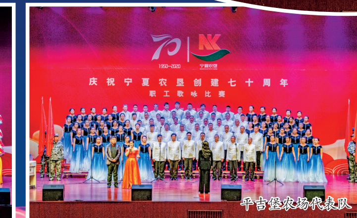
平吉堡农场代表队