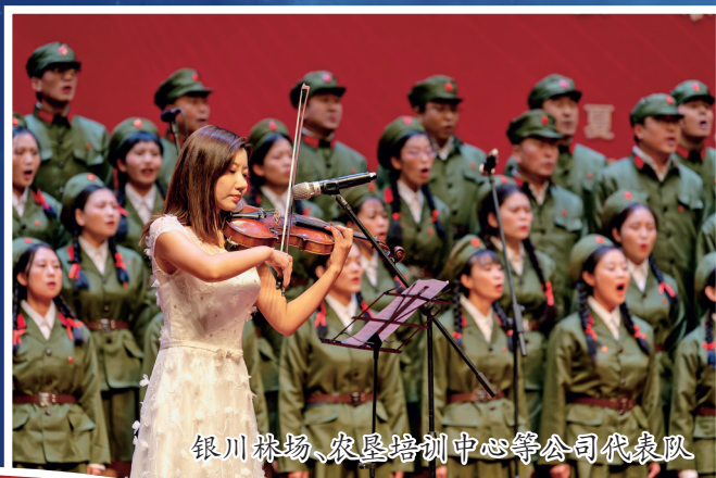
银川林场、农垦培训中心等公司代表队