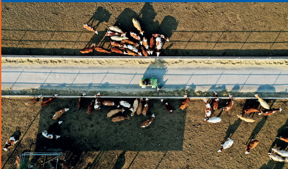
摄,无人机照片)。 场利用机械给肉牛投料(10月10日 (集团)有限公司贺兰县暖泉万头肉牛 工人在宁夏农垦贺兰山牛羊产业