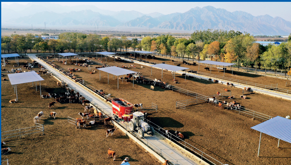
场(10月18日摄,无人机照片)。 (集团)有限公司贺兰县暖泉万头肉牛 这是宁夏农垦贺兰山牛羊产业