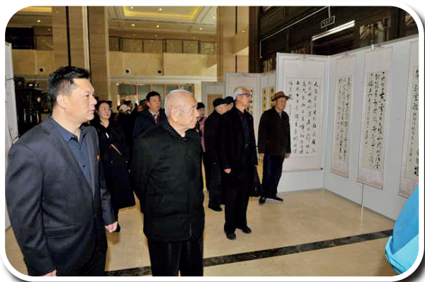
宁夏农垦集团邀请老一代创业者观看职工书画展。