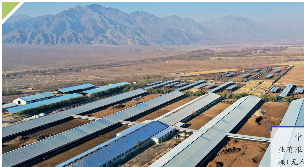
宁夏农垦贺兰山奶业有限公司奶牛养殖大棚(无人机照片)。