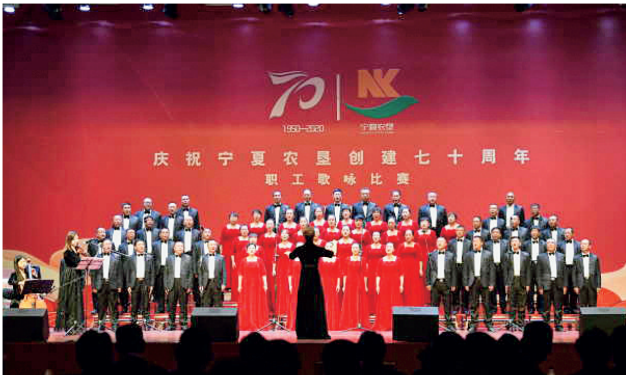
宁夏农垦集团举办创建70周年职工歌咏比赛。

曾在农垦工作过的厅级干部代表、原农垦局和农垦集团离退休厅级干部代表、国家级劳动模范代表、农场离休老干部、老党员代表、支宁支垦人员(知青)代表、科技工作者代表、职工代表、集团公司领导班子成员、集团各部门及所属各(农场)公司、事业单位主要负责同志、参股企业产权代表约130人出席座谈会。