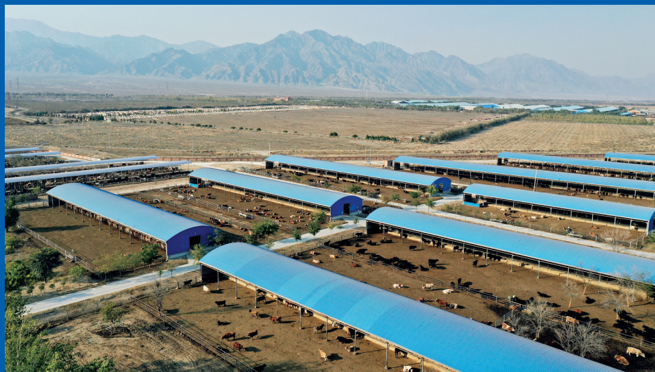
月10日摄,无人机照片)。 有限公司贺兰县暖泉万头肉牛场(宁夏农垦贺兰山牛羊产业(集团))