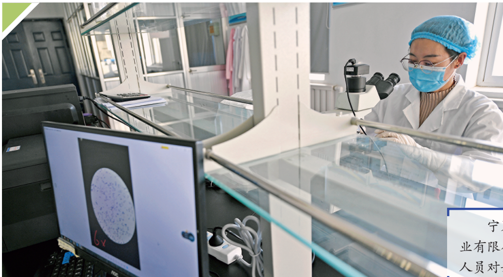
宁夏农垦贺兰山奶业有限公司化验室工作人员对奶样进行检测。