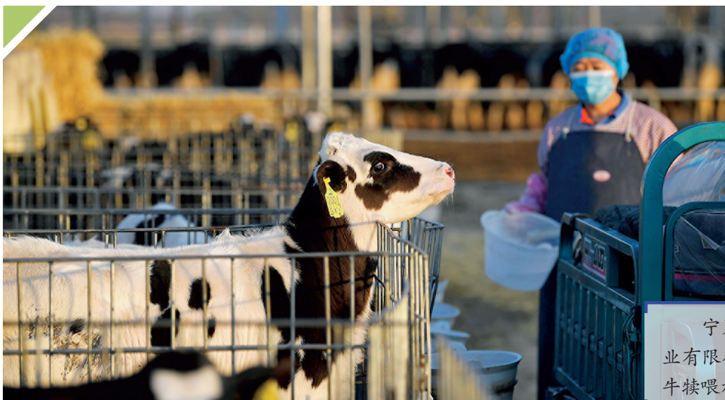
宁夏农垦贺兰山奶业有限公司工作人员给牛犊喂水。