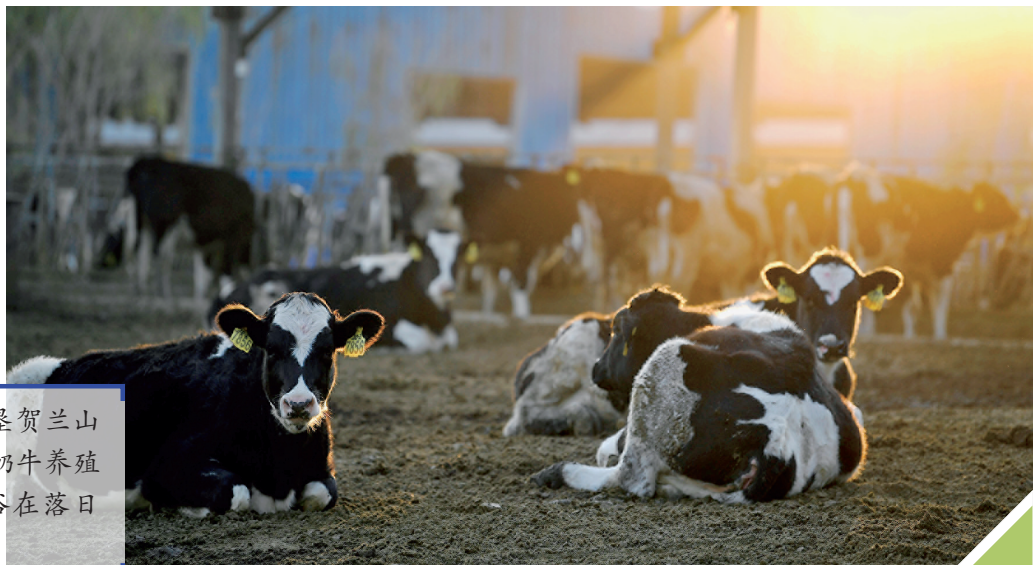
在宁夏农垦贺兰山奶业有限公司奶牛养殖园区,奶牛沐浴在落日余晖中。