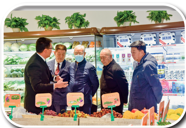
参观农垦特色产品旗舰店

夏啤酒厂。宁夏农垦引进酿酒葡萄种植和葡萄酒加工,出品了宁夏第一瓶葡萄酒;抢先发展旅游业和湿地经济,打造了宁夏的第一个国家5A级旅游胜地。培育了“贺兰山”奶业、“贺兰山”牛羊肉“灵农”鲜猪肉、“西夏王”葡萄酒、“西夏”啤酒、“碧宝”枸杞、“沙湖”旅游等10多个名优产品。宁夏农垦,在引领示范现代农业建设、保障大宗农副产品供给、维护地区社会稳定等方面,做出了重大