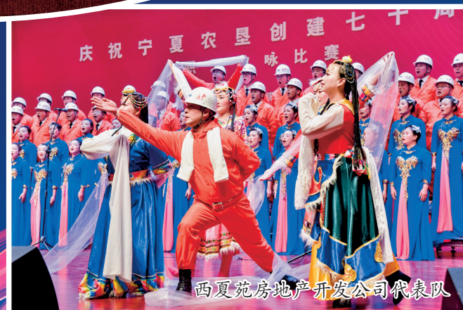
西夏苑房地产开发公司代表队