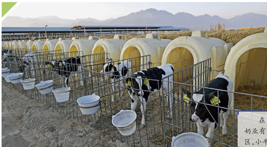
在宁夏农垦贺兰山奶业有限公司牛犊饲养区,小牛犊准备进食。