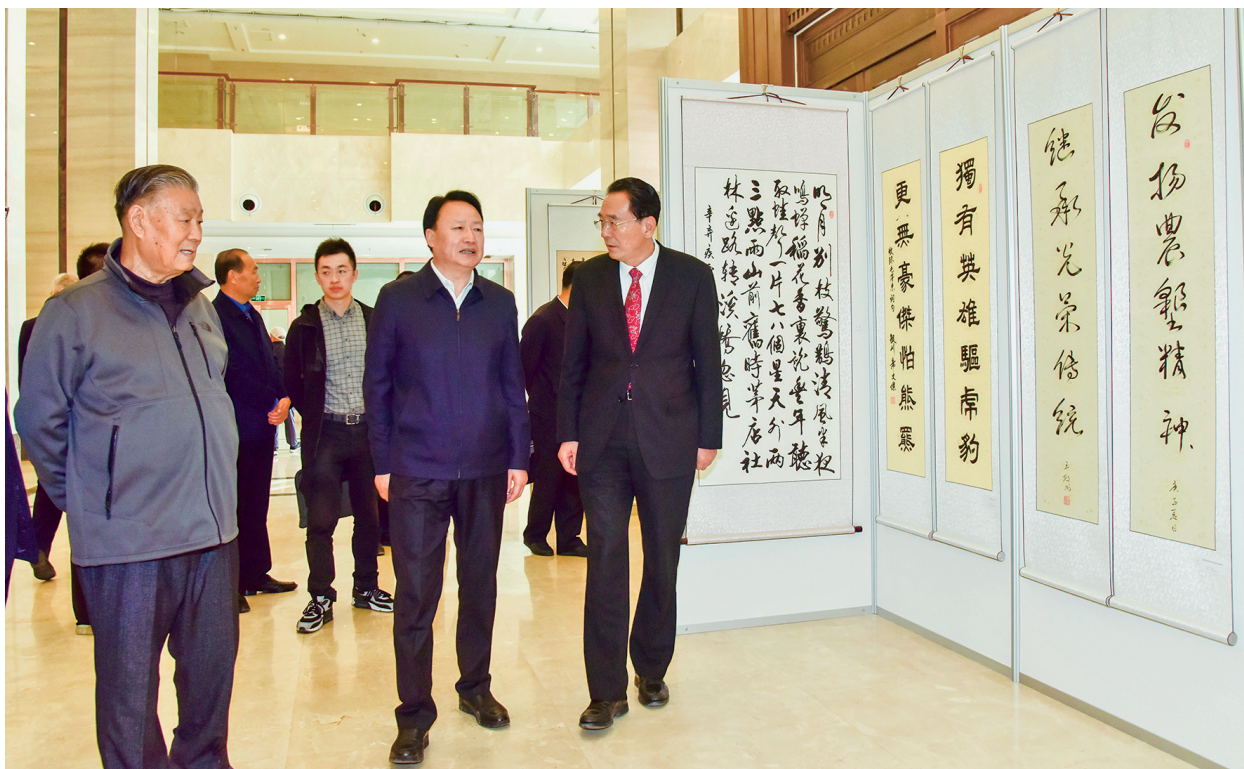
参观书画摄影作品展

70年来,三代农垦人,扎根宁夏,投身农垦事业。宁夏的第一桶牛奶,产自农垦人建造的奶牛养殖场;宁夏的第一杯啤酒,产自农垦人建成的西